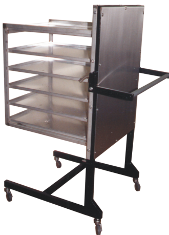
Obrázek: Vozík pro jogurtovač

Připojení flexo kabelem 3x1,5 / 230V / TN-S o délce 5m. Přívod musí být jistič 16 A.