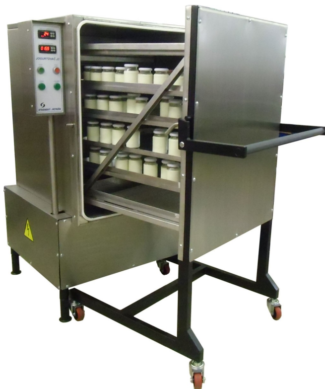
Obrázek: Pootevřený jogurtovač

Jsme potěšeni, že jste si zakoupili jogurtovač. Doufáme, že Váš nový jogurtovač uspokojí všechna Vaše přání a požadavky. Doporučujeme Vám, abyste si pečlivě přečetli všechny informace uvedené v této příručce, pomohou Vám plně využít všech schopností jogurtovače. Příručka poskytuje uživatelům všechny potřebné informace. Obsahuje pokyny pro instalaci, obsluhu a údržbu.