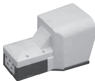
Řada PED502 s ochranným krytem